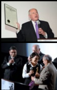
The Reel Film Club