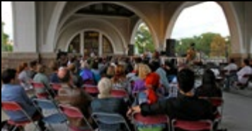
Eventos Especiales & Galas