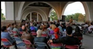
Eventos Especiais e Galas