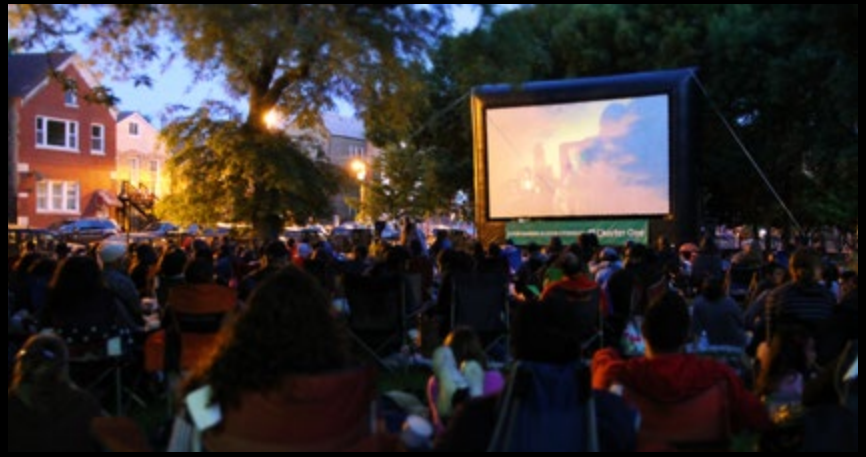
Film in the Park

O filme é um meio poderoso através do qual podemos compartilhar as nossas experiências de vida. A criatividade, ingenuidade, desafios e desempenhos dos nossos realizadores nos