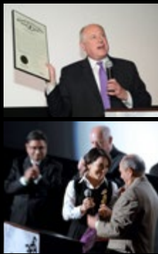
The Reel Film Club